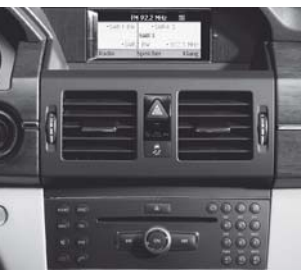
Audio 50 APS