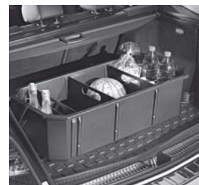
Kofferraumwanne, flach mit Staubox