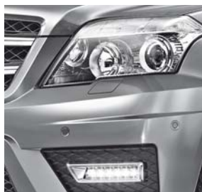
Intelligent Light System mit LED-Tagfahrleuchte