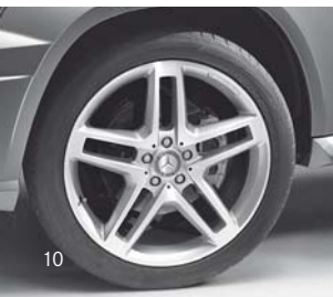
AMG Leichtmetallräder (783)