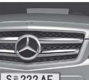
Kühlergrill mit Chromlamellen