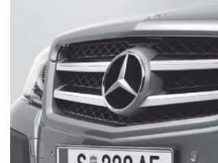
Kühlergrill 2 Chromlamellen (U89)