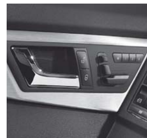
vollelektrische Sitzverstellung inkl. Memoryfunktion