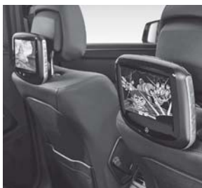
Fond Entertainment System Kit