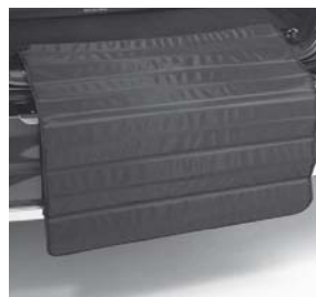
Zick-Zack-Ladekantenschutz (Abbildung ähnlich)