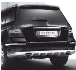
Dachspoiler, Heckschürzenblende mit Diffusor-Optik