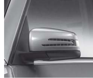
Außenspiegel mit Blinkleuchte

Zentralverriegelung mit Innenschalter und Crash-Sensor