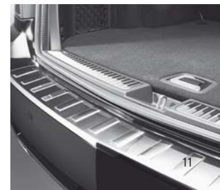
Ladekante in Chrom-/Edelstahl