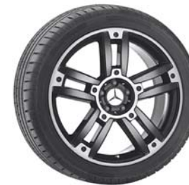
Bigawa, 5-Doppelsp.-Design schwarz, bicolor