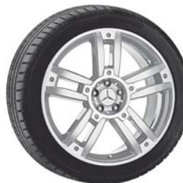
Bigawa, 5-Doppelsp.-Design, titan-silber, glanzgedreht