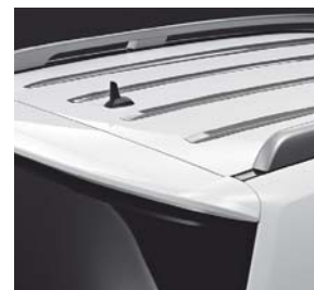
Dachleiste, Hochglanz verchromt