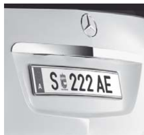
Heckzierleiste, Hochglanz verchromt