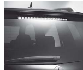
3. Bremsleuchte in LED-Technik