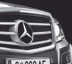
Kühlergrill mit 3 Chromlamellen