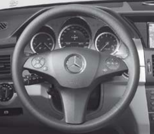
Komfort-Multifunktionslenkrad in Leder in Leder