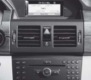
Audio 20 CD