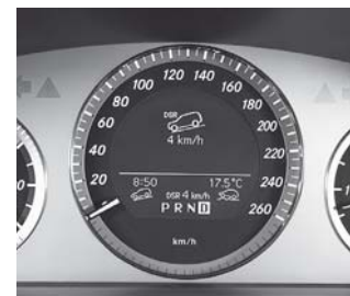
Downhill Speed Regulation (430)