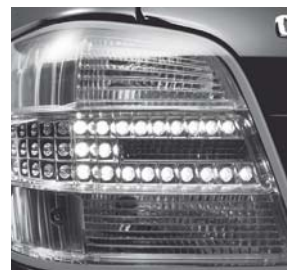
Intelligent Light System Heckleuchte