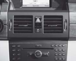
Audio 20 CD