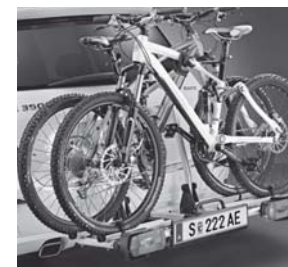
Heckfahrradträger auf Anhängervorrichtung