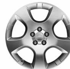
18" MIT 5 SPEICHEN STYLE 518