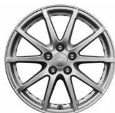
17" MIT 10 SPEICHEN STYLE 105