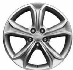
17" MIT 5 SPEICHEN STYLE 522