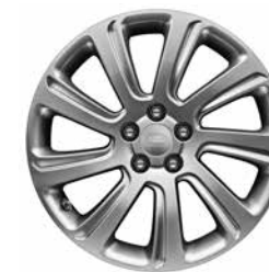
18" MIT 9 SPEICHEN STYLE 109