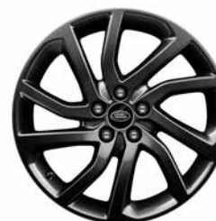
18" MIT 5 GETEILTEN SPEICHEN IN SATIN DARK GREY STYLE 511