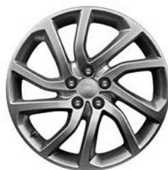
18" MIT 5 GETEILTEN SPEICHEN STYLE 511