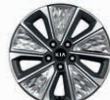
17-Zoll-Leichtmetallfelgen mit Bereifung 215/55 R17

Detaillierte Informationen zum Kia e-Soul finden Sie unter www.kia.com/de/broschuere . Dort können Sie sich auch die komplette Modellbroschüre herunterladen.