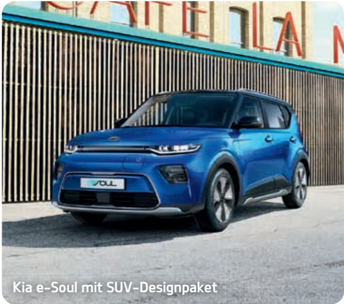
Kia e-Soul mit SUV-Designpaket