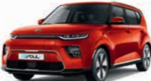
Marsorange Metallic (M3R)