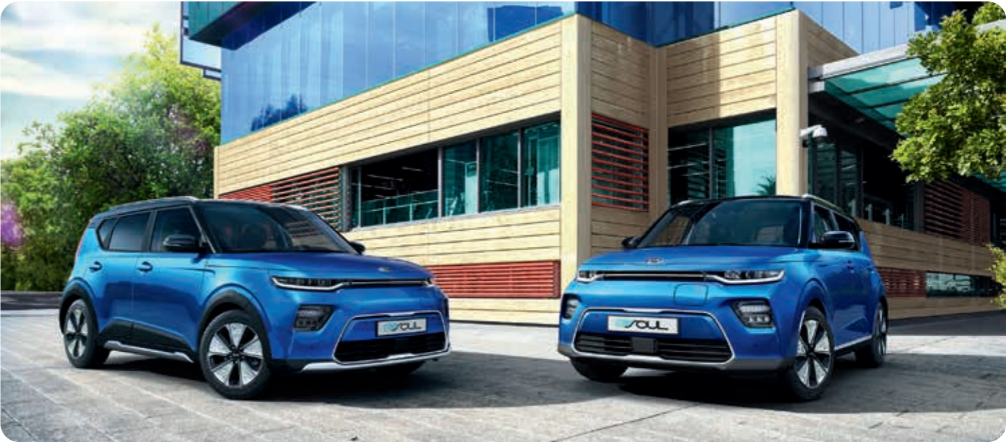
Abbildungen zeigen kostenpflichtige Sonderausstattung.