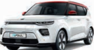
Schneeweiß mit rotem Dach (AH1)