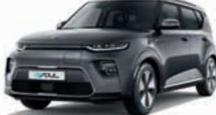
Gravitygrau Metallic (KDG)