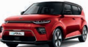
Infernorot Metallic mit schwarzem Dach (AH4)