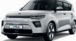
Sparklingsilber Metallic (KCS)