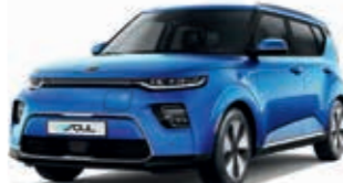
Neptunblau Metallic (B3A)

Bei einigen unserer modernen Metallicfarben werden bewusst unterschiedliche Farbpigmente verwendet. Dadurch können unter bestimmten Lichtverhältnissen, z.B. direktes Sonnenlicht, attraktive Farbeffekte erzielt werden. Zum Teil kann die Farbe changieren, z.B. von schwarz zu dunkelblau. Bei den hier abgebildeten Farbdarstellungen kann es aufgrund der Drucktechnik zu Abweichungen zu den Originalfarben kommen. Weitere Informationen zu den Farbeffekten und Grundfarben gibt Ihnen gerne Ihr Kia-Vertragshändler. Metalliclackierungen sind aufpreispflichtig.