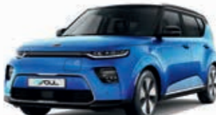
Neptunblau Metallic mit schwarzem Dach (SE2)