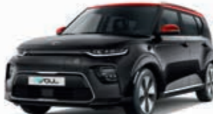
Cassisschwarz Metallic mit rotem Dach (AH5)