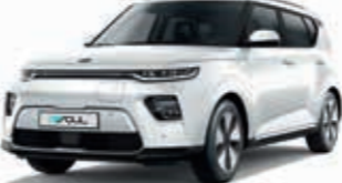
Snow White Pearl (SWP)