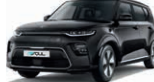
Cassisschwarz Metallic (9H)