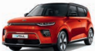
Marsorange Metallic mit schwarzem Dach (SE3)