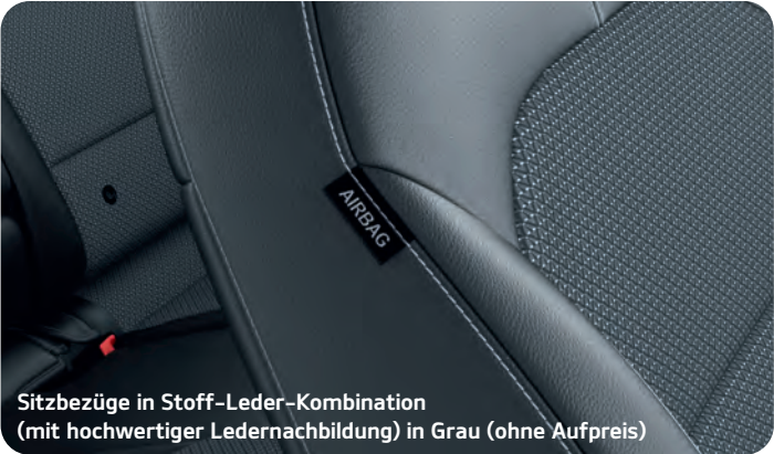
Sitzbezüge in Stoff-Leder-Kombination (mit hochwertiger Ledernachbildung) in Grau (ohne Aufpreis)