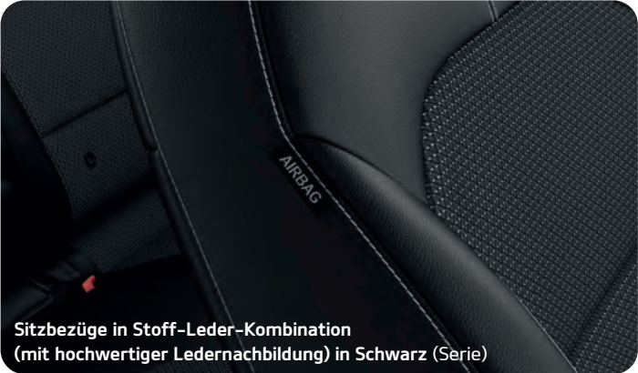
Sitzbezüge in Stoff-Leder-Kombination (mit hochwertiger Ledernachbildung) in Schwarz (Serie)

Neben seinem eleganten, modernen Design zeichnet sich der Innenraum des Kia e-Niro durch hochwertige Materialien aus. Dazu gehören viele Soft-Touch-Oberflächen, Applikationen in Glanzschwarz+ an Armaturenbrett und Türverkleidungen und Sitzbezüge in Stoff oder Leder und hochwertiger Ledernachbildung+, wahlweise in Schwarz, Grau oder Schwarz mit Akzentuierung in Electric Blue.