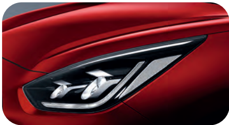
Runway Rot Metallic (CR5)