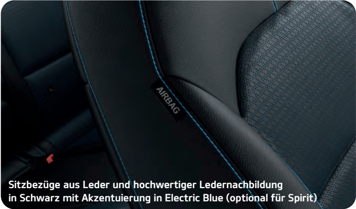
Sitzbezüge aus Leder und hochwertiger Ledernachbildung in Schwarz mit Akzentuierung in Electric Blue (optional für Spirit)