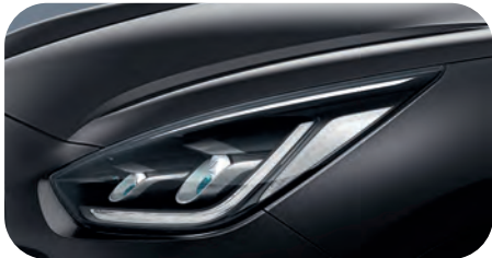
Interstellar Grau Met. (AGT)