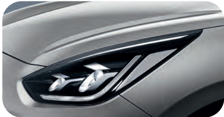
Seidensilber Metallic (4SS)