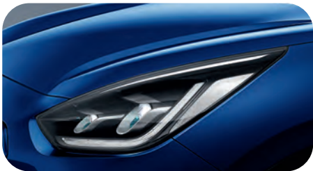
Yachtblau Metallic (DU3)