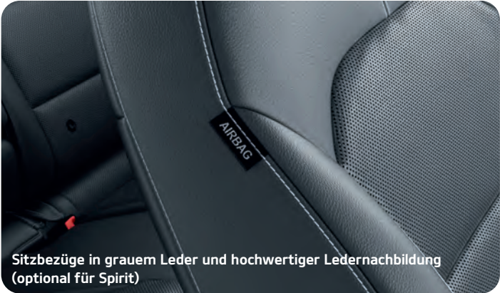
Sitzbezüge in grauem Leder und hochwertiger Ledernachbildung (optional für Spirit)