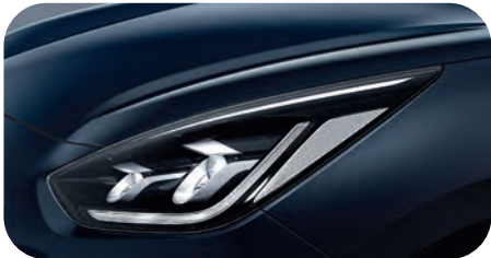
Gravityblau Metallic (B4U)