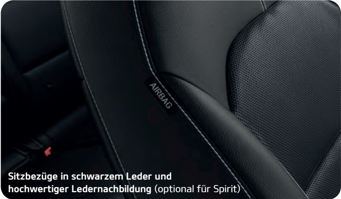
Sitzbezüge in schwarzem Leder und hochwertiger Ledernachbildung (optional für Spirit)