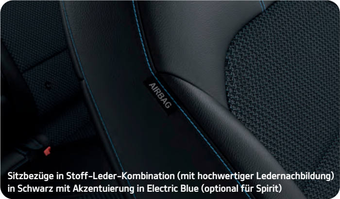
Sitzbezüge in Stoff-Leder-Kombination (mit hochwertiger Ledernachbildung) in Schwarz mit Akzentuierung in Electric Blue (optional für Spirit)