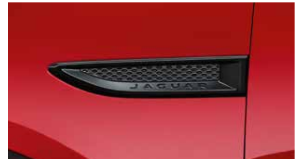
Seitliche Luftauslässe – Schwarz glänzend