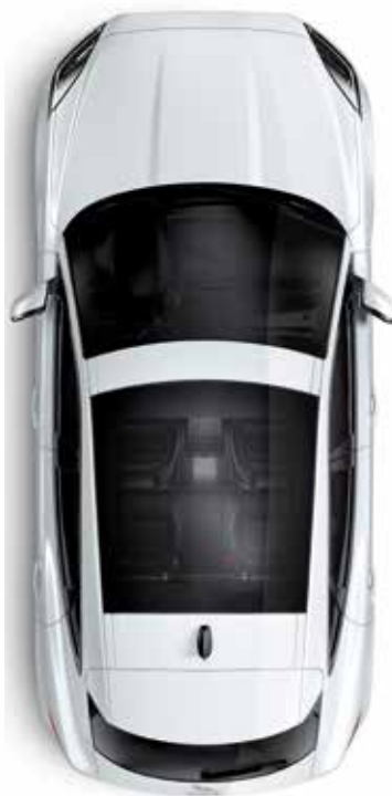
Panoramadach mit elektrischer Sonnenblende in Wagenfarbe (optional)