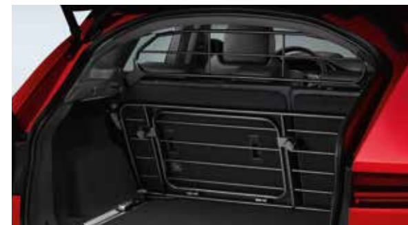
Gepäckraum-/Hundeschutzgitter - volle Höhe