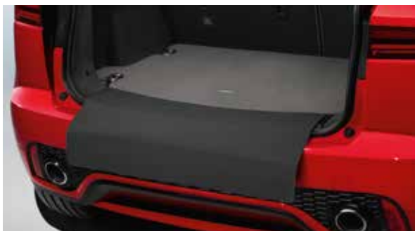
Gepäckraum-Teppichmatte „Luxury“ mit Stoßfängerschutz