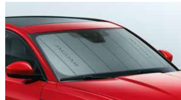
Sonnenschutzblende für die Windschutzscheibe