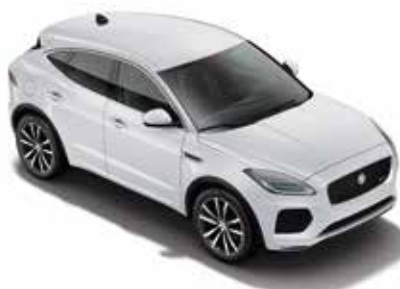
Wagenfarbe: Yulong White (Metallic)