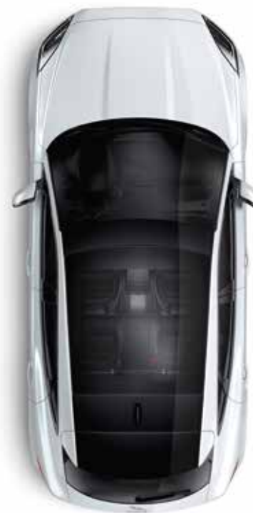
Panoramadach mit elektrischer Sonnenblende in Kontrastlackierung – Schwarz* (optional)

*Nicht in Verbindung mit Fahrzeuglackierungen in Narvik Black, Santorini Black oder Farallon Pearl Black erhältlich.