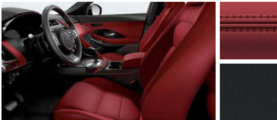
Abgebildete Innenausstattung: E-PACE R-Dynamic HSE mit Innenraum in Ebony/Mars Red mit Nähten in Rot, Sportsitze in Windsor-Leder in Mars Red sowie Dachhimmel in Ebony.