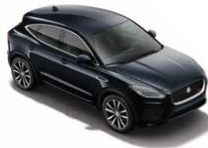
Wagenfarbe: Farallon Pearl Black (Premium Metallic)