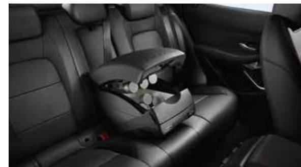
Kühl-/Warmhaltebox mit Mittelarmlehne