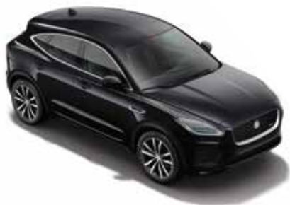
Wagenfarbe: Santorini Black (Metallic)