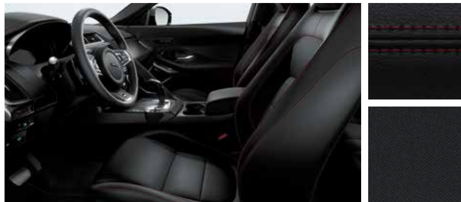
Abgebildete Innenausstattung: E-PACE Chaquered Flag mit Innenraum in Ebony/Ebony mit Nähten in Flame Red, Sportsitze in genarbtem Leder sowie Dachhimmel in Ebony. Diese Innenausstattung ist exklusiv für den E-PACE Chaquered Flag verfügbar.