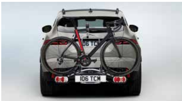
Fahrradträger für Anhängerkupplung