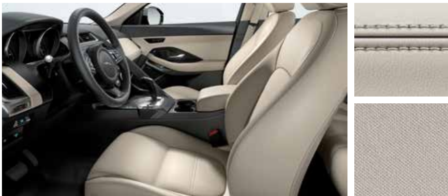
Abgebildete Innenausstattung: E-PACE S mit Innenraum in Lunar/Light Oyster mit Nähten in Light Oyster, Sitze in genarbtem Leder sowie Dachhimmel in Light Oyster. Diese Innenausstattung ist auch für den E-PACE SE erhältlich.