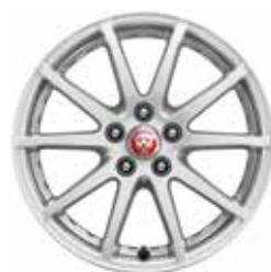
17" mit 10 Speichen (Style 1005)