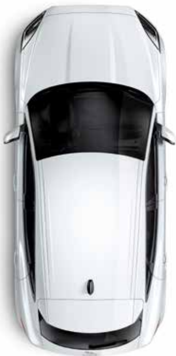
Dach in Wagenfarbe (serienmäßig)

Passend zu Ihrem persönlichen Stil bietet der E-PACE eine Auswahl von Dachvarianten, die jeweils ihren ganz eigenen Charakter haben. Sie können Ihrem Fahrzeug damit eine persönliche Note verleihen, die sowohl im Innenraum als auch von außen sichtbar ist.