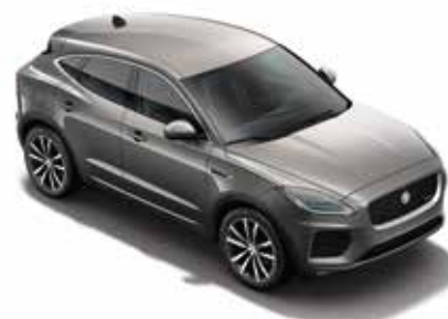
Wagenfarbe: Silicon Silver (Premium Metallic)