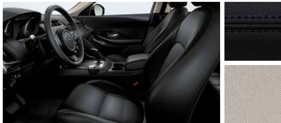
Abgebildete Innenausstattung: E-PACE S mit Innenraum in Ebony/Ebony mit Nähten in Ebony, Sitze in genarbtem Leder sowie Dachhimmel in Light Oyster. Diese Innenausstattung ist auch für den E-PACE SE erhältlich.