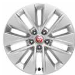
17" mit 10 Speichen (Style 1037) 1