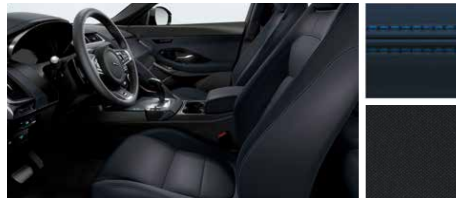
Abgebildete Innenausstattung: E-PACE R-Dynamic HSE mit Innenraum in Ebony/Eclipse mit Nähten in Reims Blue, Sportsitze in Windsor-Leder in Eclipse sowie Dachhimmel in Ebony.