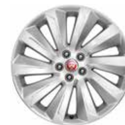
19" mit 10 Speichen (Style 1039)