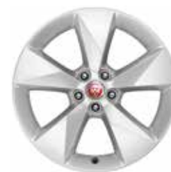
18" mit 5 Speichen (Style 5048)