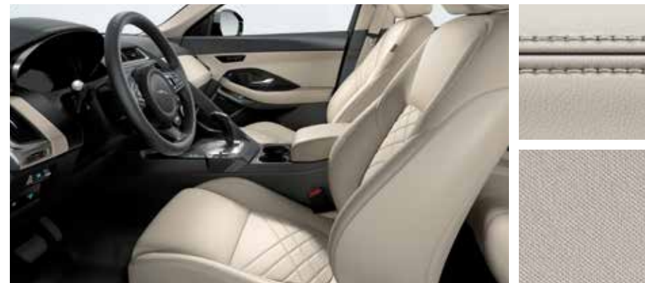
Abgebildete Innenausstattung: E-PACE HSE mit Innenraum in Lunar/Light Oyster mit Nähten in Light Oyster, Sitze in Windsor-Leder sowie Dachhimmel in Light Oyster.