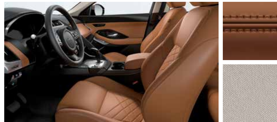
Abgebildete Innenausstattung: E-PACE HSE mit Innenraum in Ebony/Siena Tan mit Nähten in Siena Tan, Sitze in Windsor-Leder in Siena Tan sowie Dachhimmel in Light Oyster.