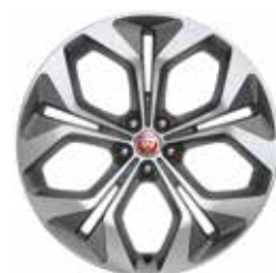
19" mit 5 Speichen (Style 5049)