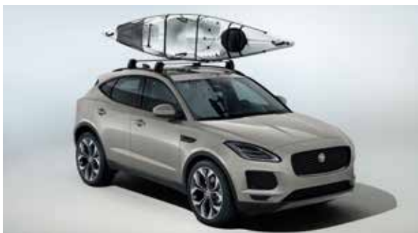
Dachgepäckträger „Aqua Sports“ – 2 Kajaks