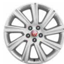
18" mit 9 Speichen (Style 9008)