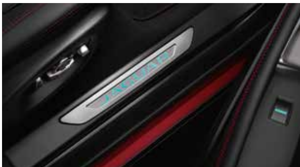
Einstiegsleisten – beleuchtet