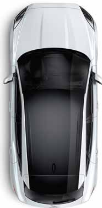
Dach in Kontrastlackierung – Schwarz* (optional)