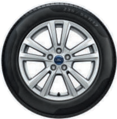
17" Leichtmetallräder im 5x2-Speichen-Design