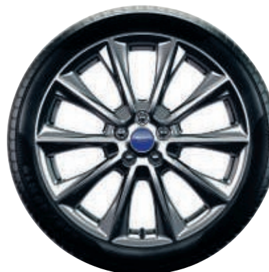
19" Leichtmetallräder im 10-Speichen-Design, glänzend