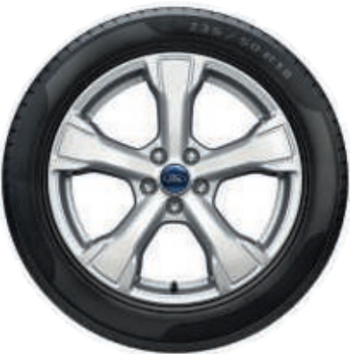
18" Leichtmetallräder im 5-Speichen-Design