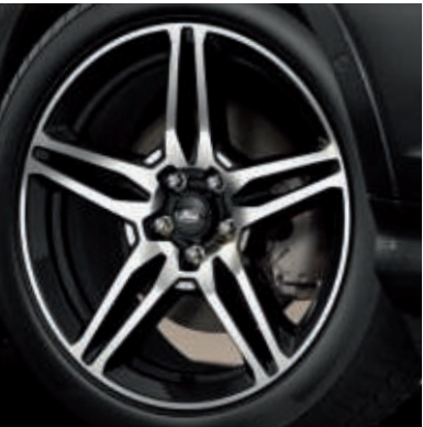
19"-Leichtmetallräder im 5x2-Speichen-Design, glanzgedreht