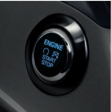
Ford Power-Startfunktion (schlüssel freies Starten)