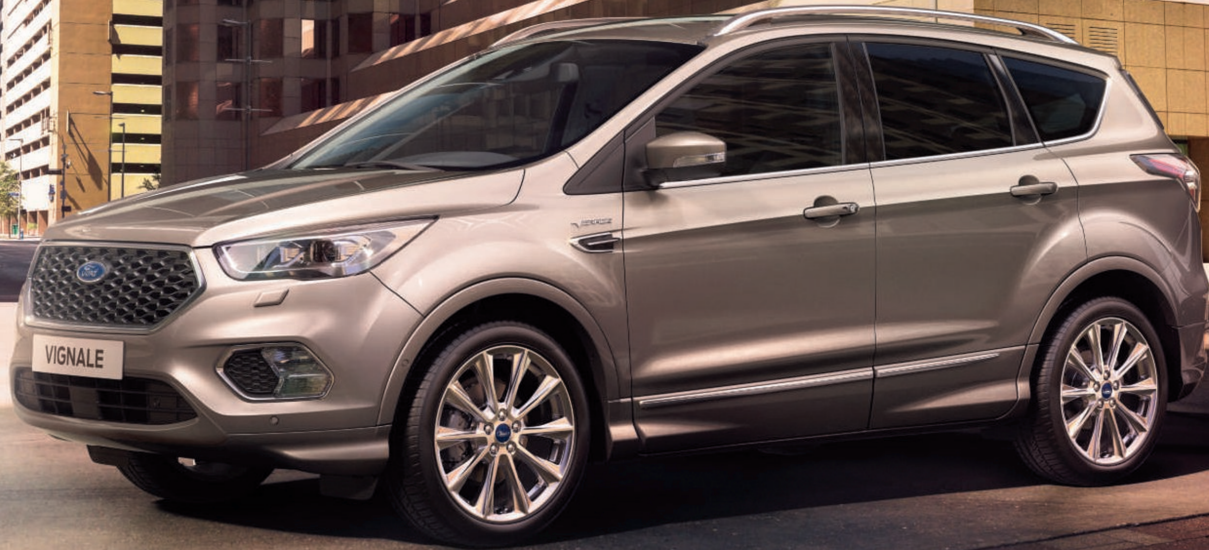
Abbildung zeigt einen Ford Kuga Vignale in der exklusiven Vignale-Lackierung Milano Grigio (Wunschausstattung).

Lernen Sie den Ford Kuga Vignale kennen. Einen Ford Vignale zu besitzen ist ein einzigartiges Erlebnis: Seine exklusiven Ausstattungsmerkmale und die besonderen Serviceleistungen, die wir für jeden Ford Vignale anbieten, sind darauf ausgelegt, Ihnen zu helfen, Ihre wertvolle Zeit optimal zu nutzen. Jedes Fahrzeug steht für Handwerkskunst und ist durch Liebe zum Detail gekennzeichnet.