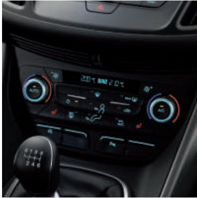
Klimaanlage mit automatischer Temperaturkontrolle (2-Zonen-Klimaautomatik)