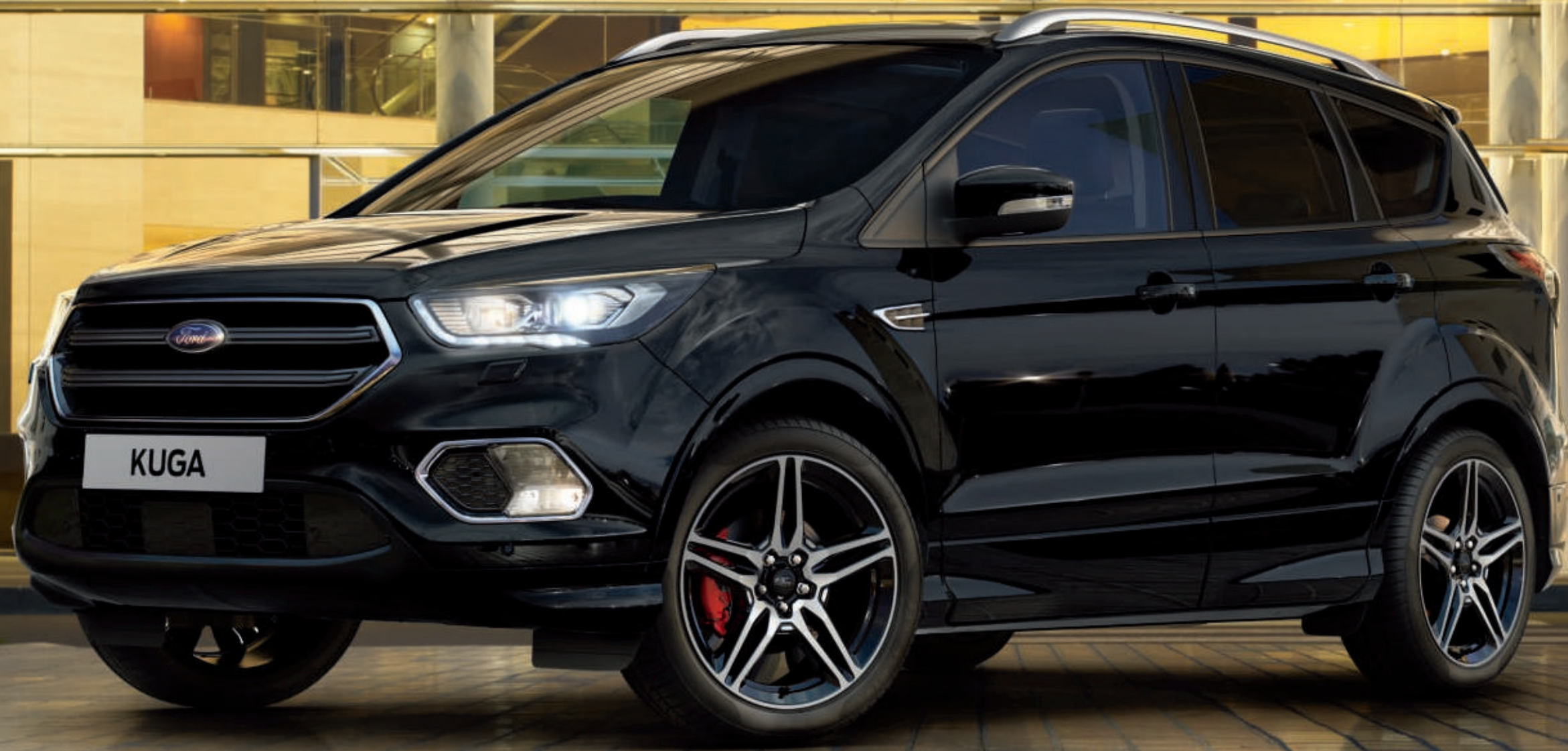
Abbildung zeigt einen Ford Kuga Black & Silver in Iridium-Schwarz Mica (Wunschausstattung).