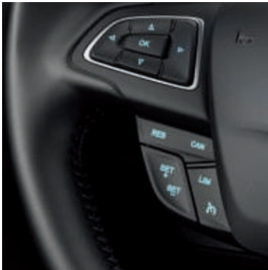
Geschwindigkeitsregelanlage mit Geschwindigkeitsbegrenzer