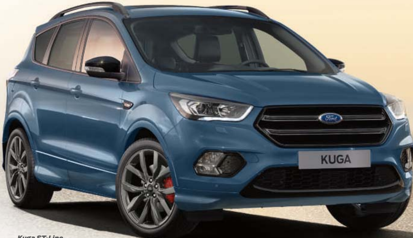
Kuga ST-Line in Chroma-Blau Metallic (Wunschausstattung).

Kraftstoffverbrauch und CO 2 -Emissionen für alle in der Broschüre aufgeführten Modelle nach dem vorgeschriebenen Messverfahren (§2 Nrn. 5, 6, 6a Pkw- EnVKV in der jeweils geltenden Fassung): 9,5 - 5,4 l/100km (kombiniert); 216 - 141 g/km (kombiniert). Hinweis: Die jeweiligen Verbrauchs- und Emissionswerte finden Sie ab Seite 44 dieser Broschüre