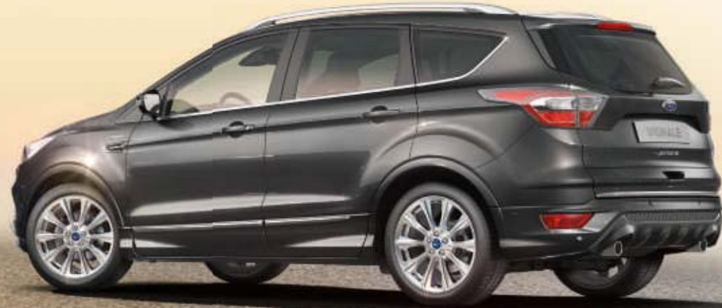
Kuga Vignale in Magnetic-Grau Metallic (Wunschausstattung).