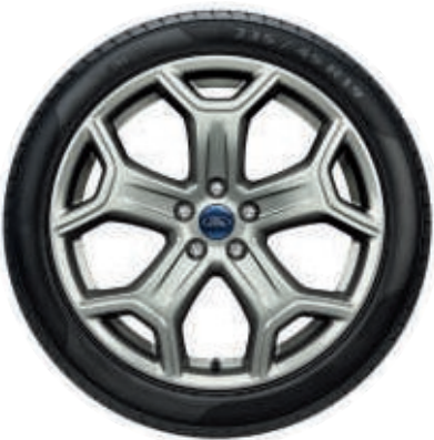
19" Leichtmetallräder im 5-Speichen-Y-Design