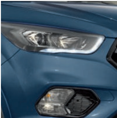
Scheinwerfer, dunkel abgesetzt und LED-Tagfahrlicht