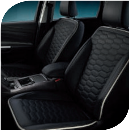
exklusive Lederpolsterung in Anthrazit 3)