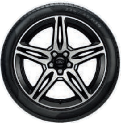
19" Leichtmetallräder im 5x2-Speichen-Design, glanzgedreht