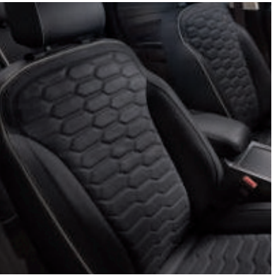
Sportsitze mit exklusiver Lederpolsterung, wabenförmig gesteppt