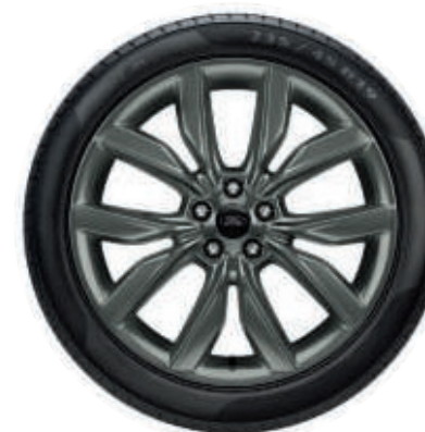
19" Leichtmetallräder im 5-Speichen-Y-Design, Rock-Metallic