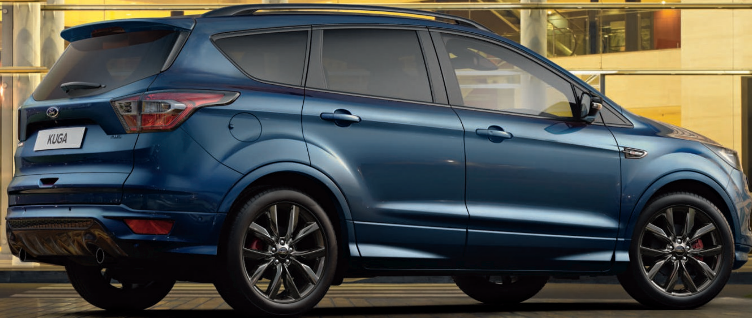
Abbildung zeigt einen Ford Kuga ST-Line in Chroma-Blau Metallic (Wunschausstattung).