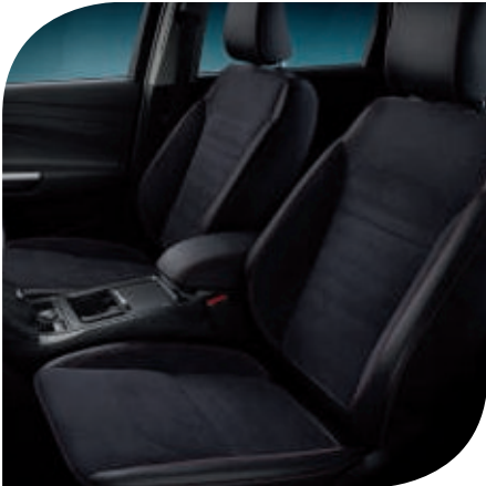
Leder-Stoff-Polsterung in Wildleder-Optik 1) mit roten Ziernähten