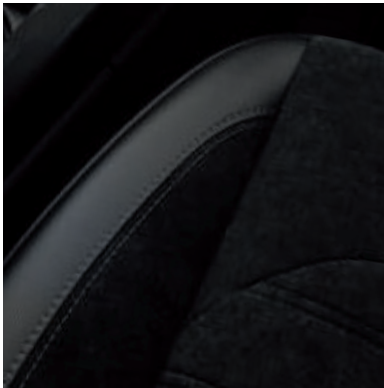
Leder-Stoff-Polsterung 1) in Wildleder-Optik mit grauen Ziernähten