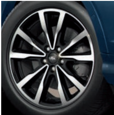
18"-Leichtmetallräder im 5x2-Speichen-Design