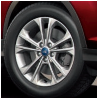
17"-Leichtmetallräder im 5x2-Speichen-Design