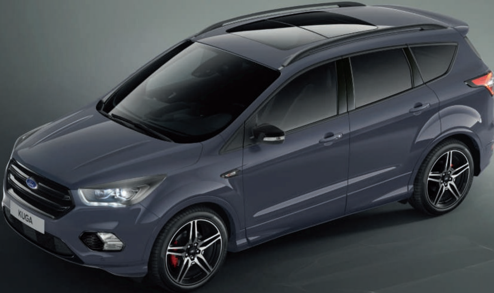
Abbildung zeigt einen Ford Kuga ST-Line in Slate-Grau (Wunschausstattung).