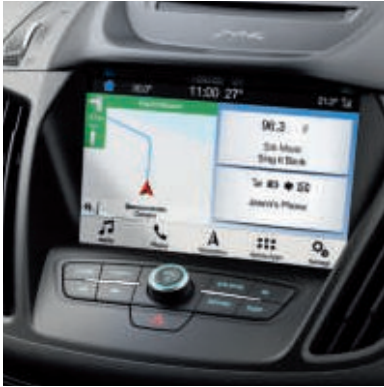
Ford Navigationssystem inkl. Ford SYNC 3 mit AppLink und Touchscreen