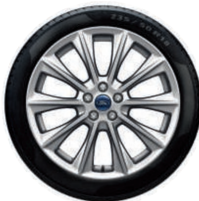
18" Leichtmetallräder im 10-Speichen-Design