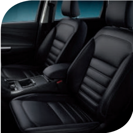
Lederpolsterung in Anthrazit 2)