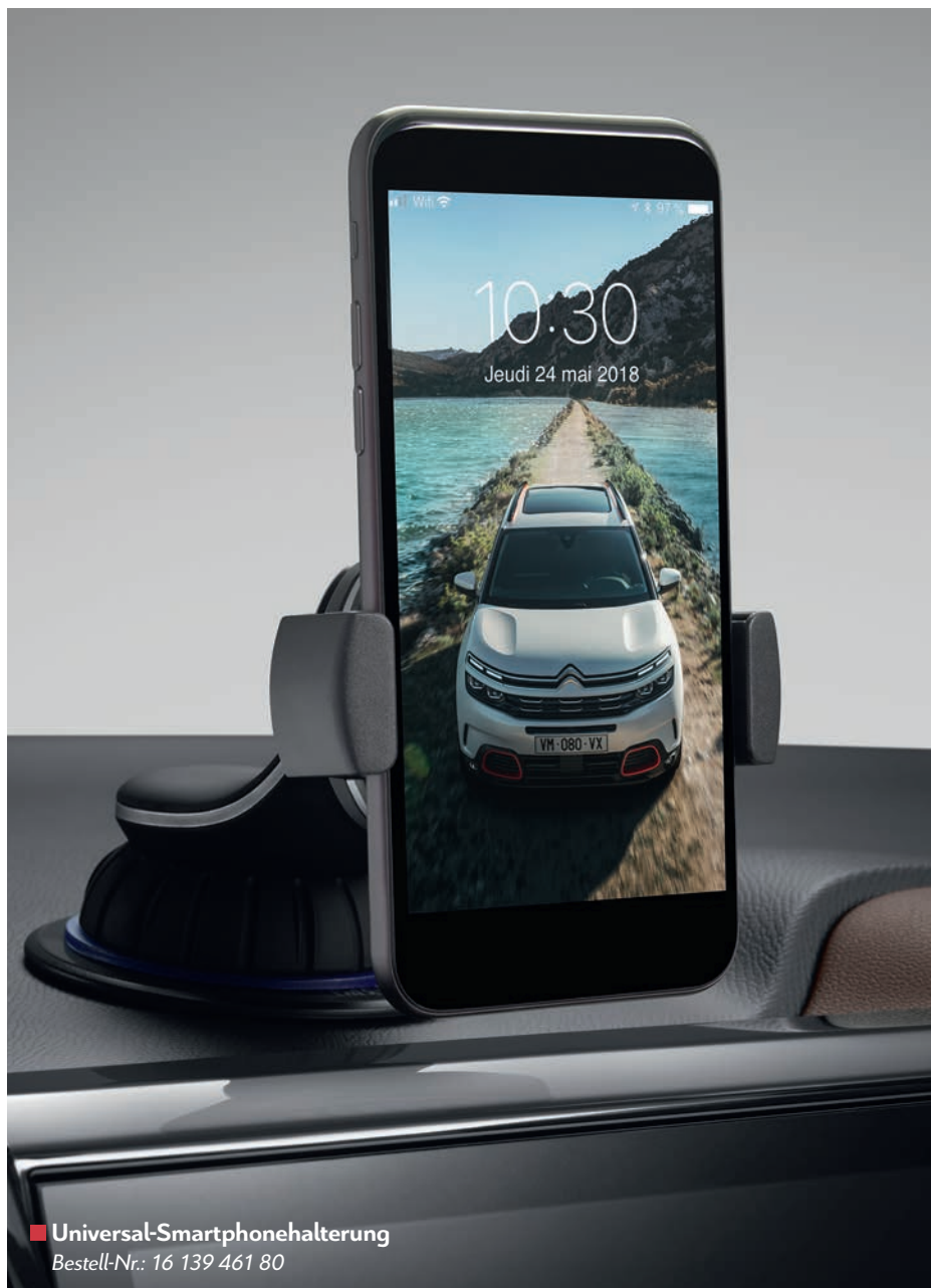
■ Universal-Smartphonehalterung Bestell-Nr.: 16 139 461 80