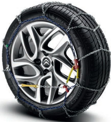
■ Satz Schneeketten für verschiedene Radgrößen Bestell-Nr.: Bitte informieren Sie sich bei Ihrem Citroën Händler.