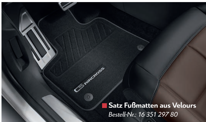
■ Satz Fußmatten aus Velours Bestell-Nr.: 16 351 297 80