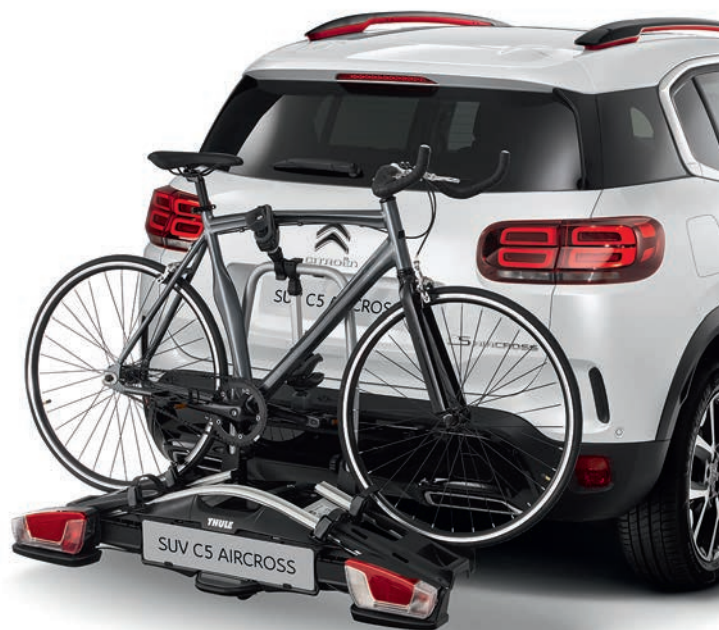
■ Fahrradträger THULE „COACH“ auf Anhängerkupplung Bestell-Nr.: 16 294 258 80