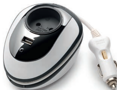
■ Adapter 12 V/230 V mit USB Bestell-Nr.: 16 290 438 80