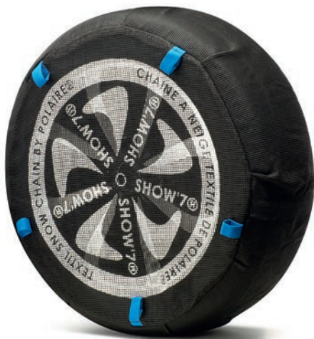
■ Satz Schneesocken für verschiedene Radgrößen Bestell-Nr.: Bitte informieren Sie sich bei Ihrem Citroën Händler.