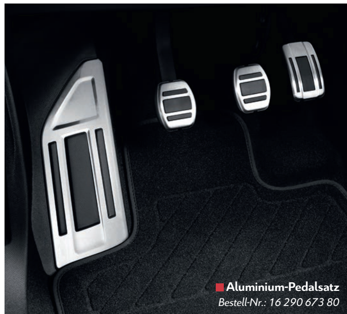
■ Aluminium-Pedalsatz Bestell-Nr.: 16 290 673 80