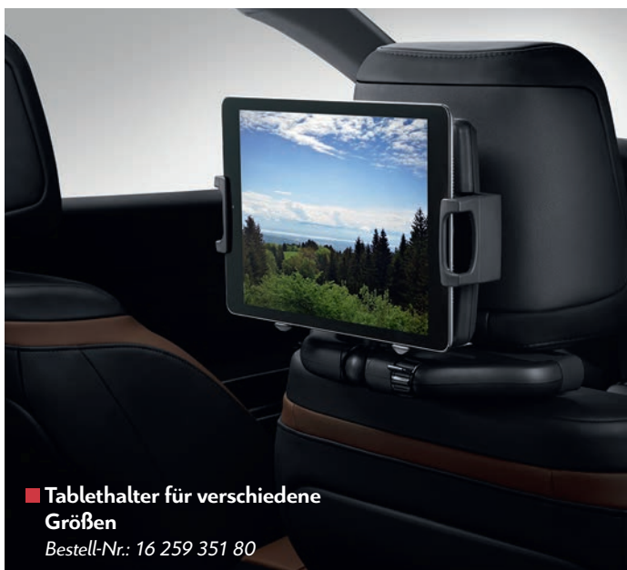
■ Tablethalter für verschiedene Größen