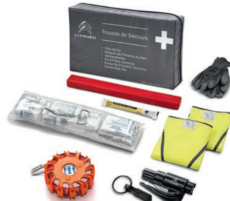
■ Sicherheitsset Bestell-Nr.: 16 239 067 80