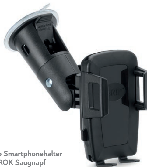
■ iGrip Smartphonehalter mit ROK Saugnapf Bestell-Nr.: 40-22-2526