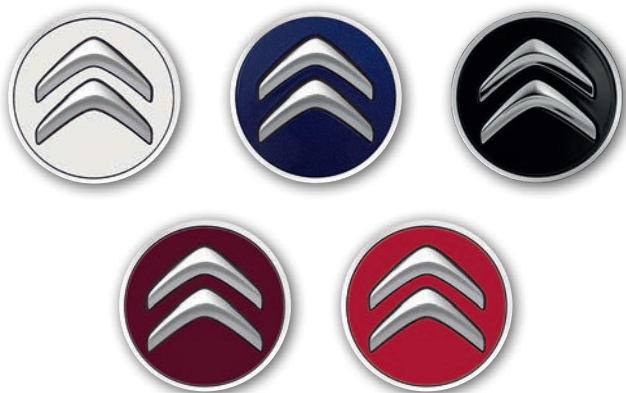
■ Satz Nabenkappen (4 Stück): Polar-Weiß, Infiniti-Blau, Schwarz, Carmen-Rot, Aden-Rot Bestell-Nr.: siehe Preisliste