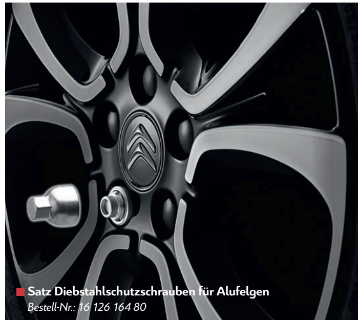
■ Satz Diebstahlschutzschrauben für Alufelgen Bestell-Nr.: 16 126 164 80