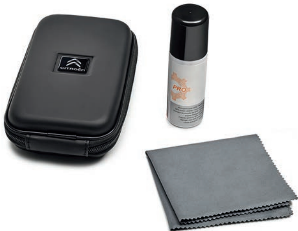
■ Bildschirm-Reinigungsset Bestell-Nr.: 16 135 816 80