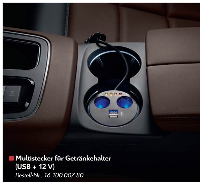
■ Multistecker für Getränkehalter (USB + 12 V)