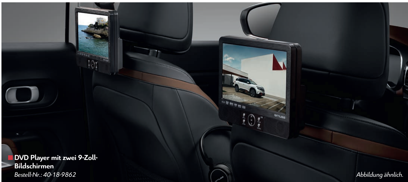
■ DVD Player mit zwei 9-Zoll-Bildschirmen