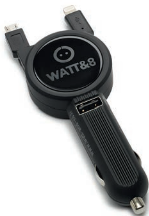
■ Ladegerät für Mobiltelefone Bestell-Nr.: 16 318 141 80