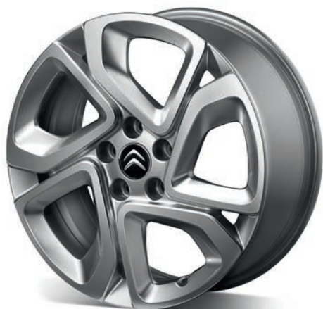
■ Satz Alufelgen 17 Zoll ELLIPSE Bestell-Nr.: 16 416 810 80