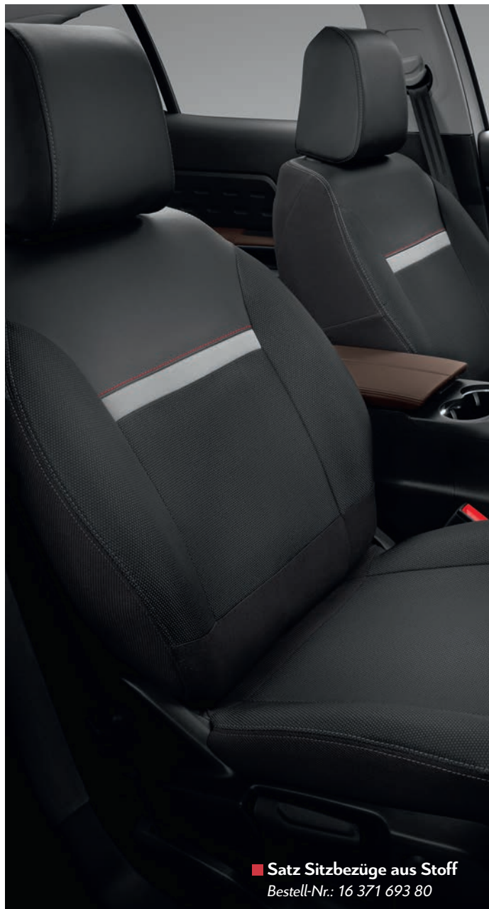
■ Satz Sitzbezüge aus Stoff Bestell-Nr.: 16 371 693 80