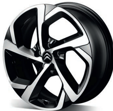
■ Satz Alufelgen 18 Zoll SWIRL Bestell-Nr.: 16 416 811 80